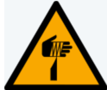
W022: Warnung vor spitzem Gegenstand