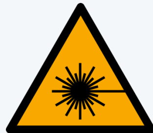
W004: Warnung vor Laserstrahl