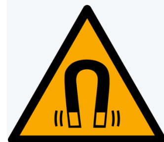
W006: Warnung vor magnetischem Feld